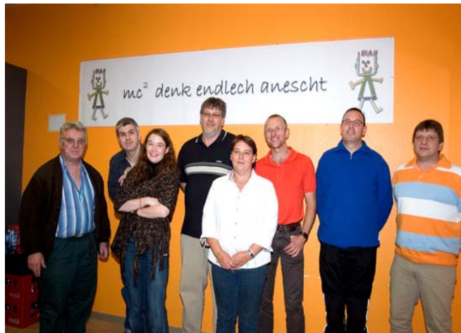
Besuch vum Fausti beim Dysi-Kids Club